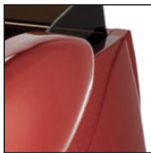
Rosso metallizzato Metallic red Rojo metalizado Rouge métallisé Rot metallisiert