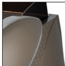
Sabbia (RAL 1035) Sand (RAL 1035) Arena (RAL 1035) Sable (RAL 1035) Sand (RAL 1035)