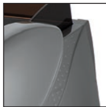
Grigio alluminio Brill (RAL 9007) Alluminium grey Brill (RAL 9007) Gris Aluminio Brill (RAL 9007) Gris Aluminium Brill (RAL 9007) Alu-Grau-Brill (RAL 9007)