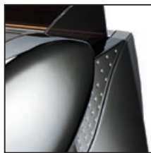
Cromato inox Chromed stainless steel Acero inoxidable Acier inox Edelstahl